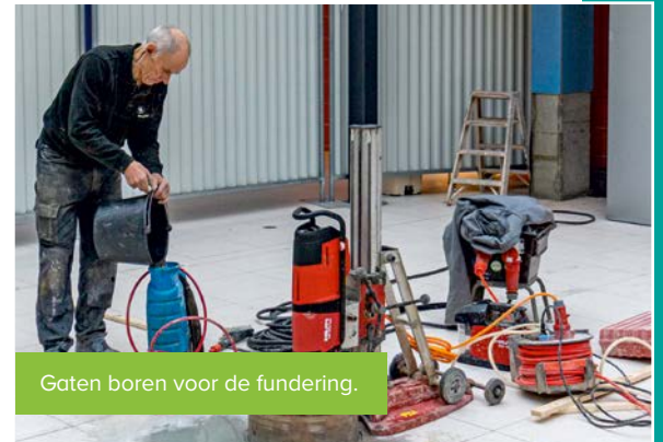
Gaten boren voor de fundering.