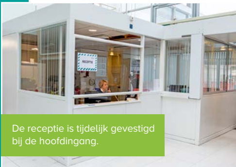
De receptie is tijdelijk gevestigd bij de hoofdingang.

Op het dak van deze functies wordt een nieuwe verdieping gemaakt. Hier kunnen patiënten en familie, maar ook personeel, straks een beneden gehaalde koffie drinken, kunnen bezoekers en patiënten op een comfortabele manier met elkaar zitten of wachten op de patiënt bij de OK, IC of dagbehandeling. Een mooie toevoeging aan het gebruik van de publieke ruimte in het ziekenhuis. De verwachting is dat de hal voor de zomer wordt opgeleverd.