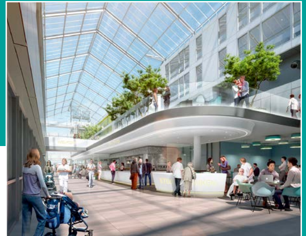
De getoonde afbeeldingen van de centrale hal zijn impressies, details kunnen in werkelijkheid afwijken.