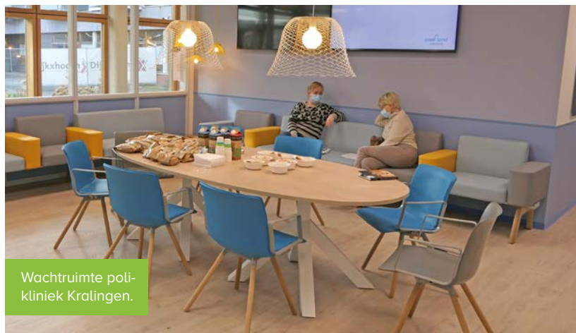
Wachtruimte polikliniek Kralingen.

Hoe zat het ook alweer? Afgelopen december is de Havenpolikliniek in Rotterdam Centrum gesloten en is een groot deel van die poliklinische zorg naar verschillende locaties in Rotterdam verhuisd. De spreekuren die in de voormalige Havenpolikliniek onder het IJsselland Ziekenhuis vielen, zijn verhuisd naar verpleeghuis en revalidatiecentrum Pniël van Lelie zorggroep aan de Oudedijk en vormen hier de nieuwe polikliniek Kralingen.