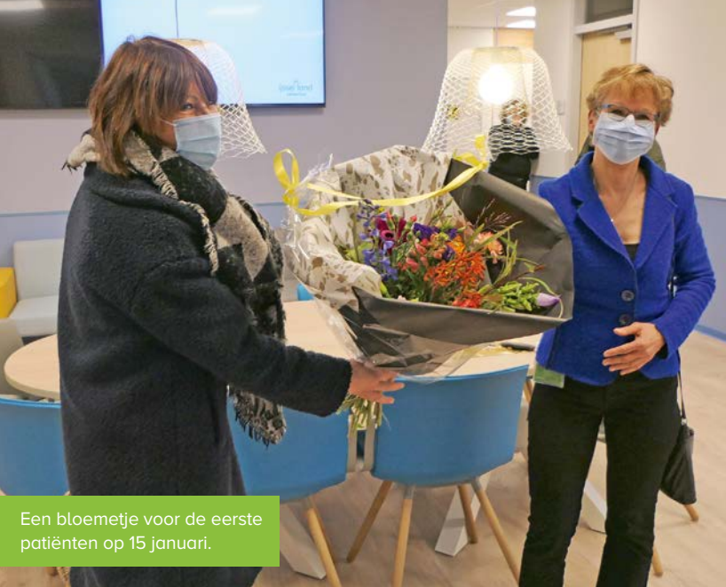
Een bloemetje voor de eerste patiënten op 15 januari.