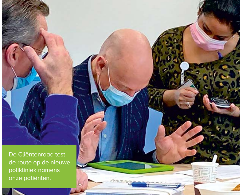
De Cliëntenraad test de route op de nieuwe polikliniek namens onze patiënten.

nodig hebt. Zij kunnen u bijvoorbeeld helpen bij praktische zaken zoals het registreren en aanmelden bij de zuilen of hulp bij het gebruik van rolstoelen.